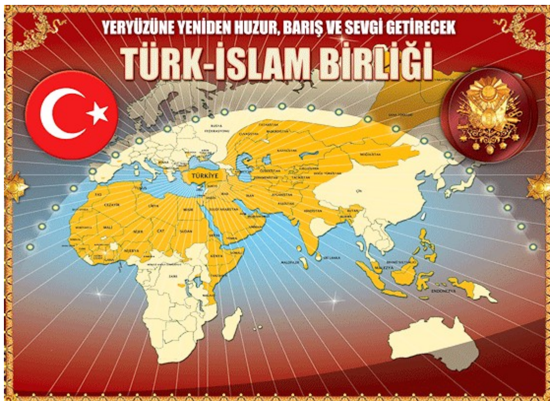
Ο Χάρτης-Ντοκουμέντο του Παγκόσμιου Τουρκο-Ισλαμικού Ράιχ Ο νέος παγκόσμιος εφιάλης της ανθρωπότητας Το Ισχυρότερο Κράτος που είδε ποτέ η γη, με 1,5 δισεκατομμύρια Μουσουλμάνους